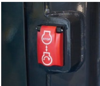
Interruptor de parada de emergencia del motor