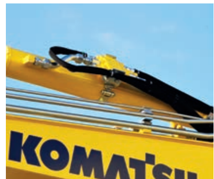
Válvulas de seguridad anticaída en la pluma y el balancín